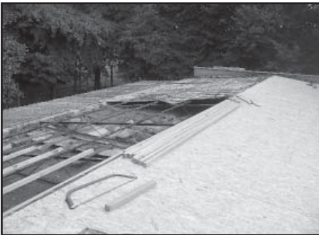
Montáž nových vrstev