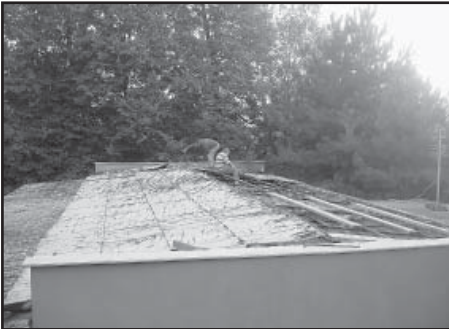
Demontáž původního střešního pláště