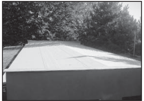
Nová střecha po dokončení