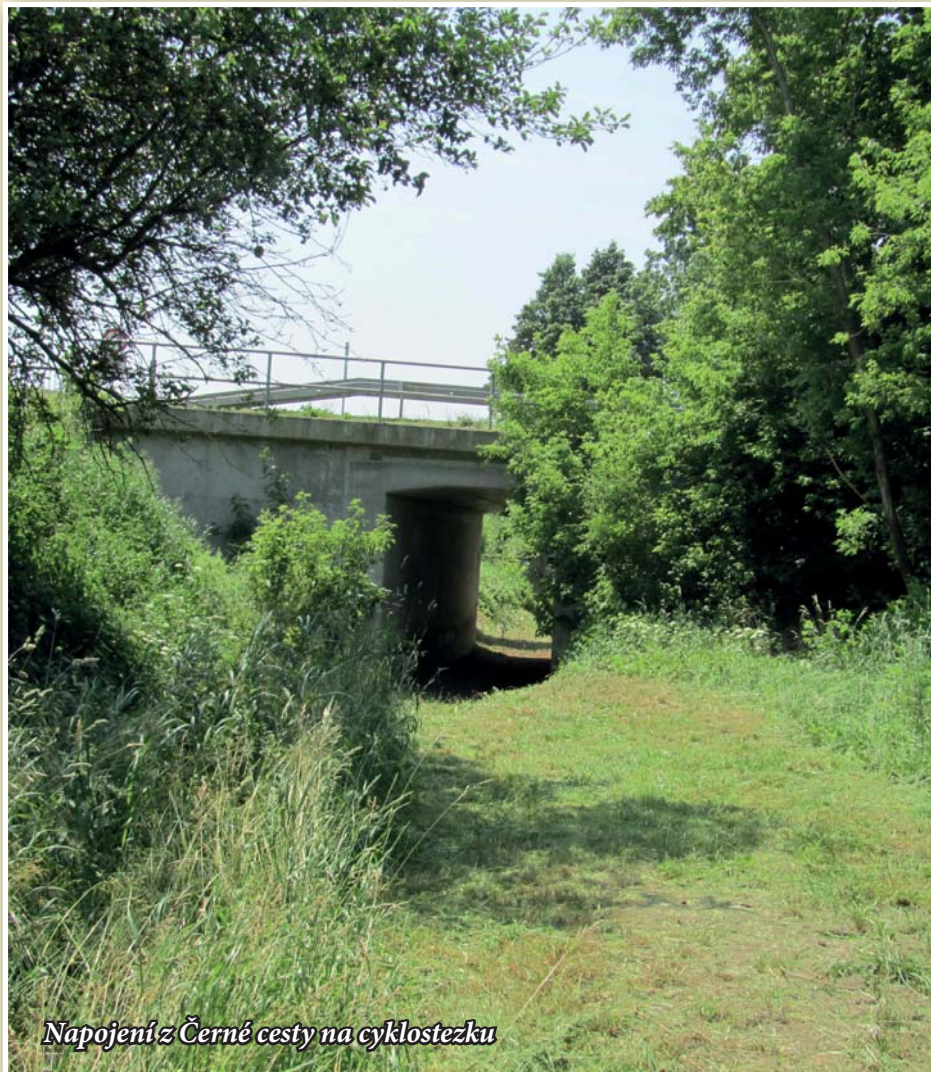
Napojení z Černé cesty na cyklostezku