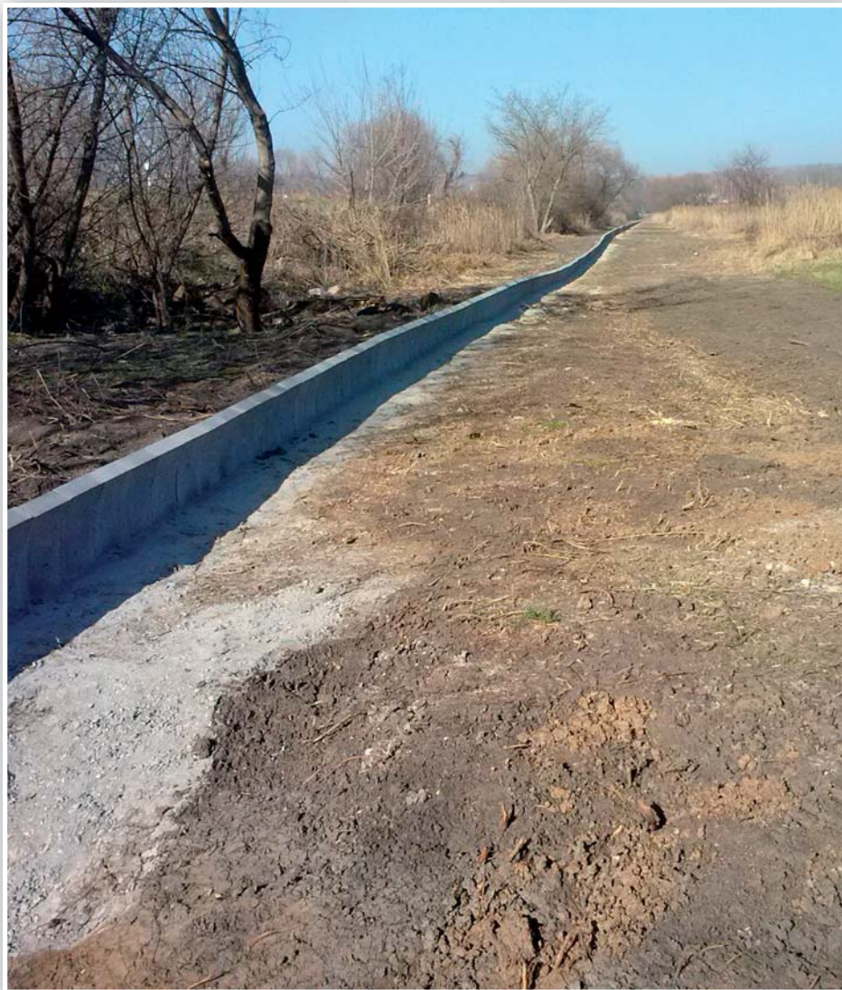
Migrační bariéra Vypálenky