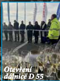
Otevření dálnice D 55