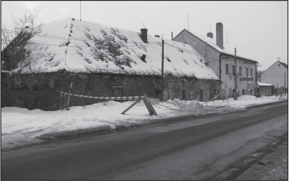
Budovy bývalého statku

„Modrý statek,, prošel mnoha stavebními fázemi a to od demolice, přes asanaci, přípravu území (zasítování, realizace komunikace a veřejného osvětlení) po současný stav, postupnou výstavbu 10 rodinných domů.