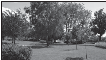
Park v Hliníku