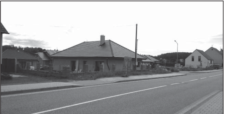
Rozestavěná ulice U školky